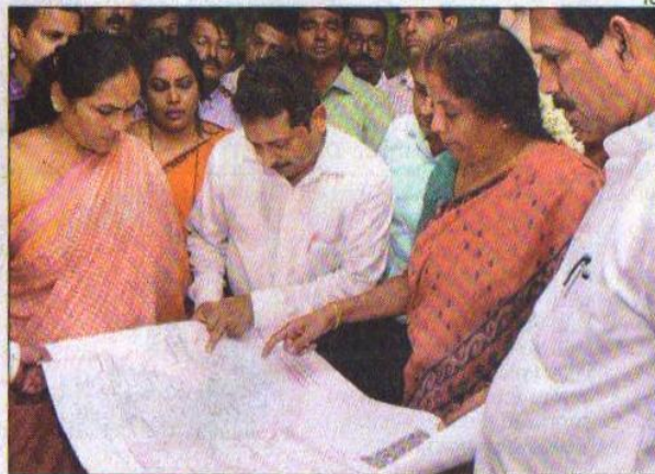
MATTER OF PRIDE: Nirmala Sitharaman (second right), Union minister of state for commerce and industry looks at the blueprint of startup incubation centre in Mangaluru on Friday

"This is a place where we want to give necessary basic infrastructure for any start-ups which are looking for space. They can come and get the ne-